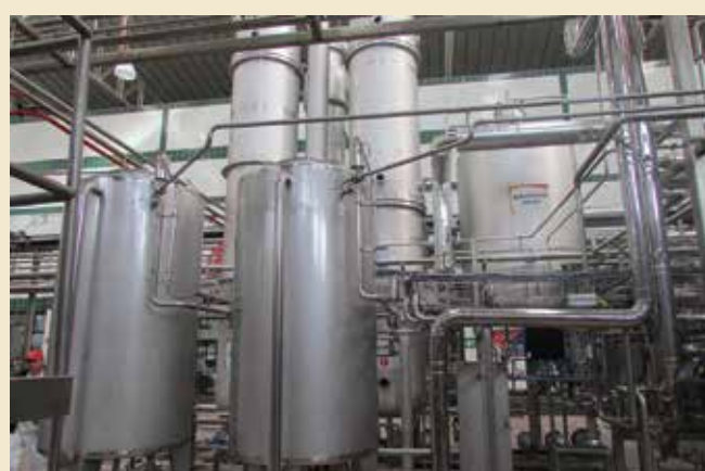
La Planta desalcoholizadora, ubicada en el área de Filtración de la Cervecería de Tocancipá, cuenta con tecnología de punta que garantiza la conservación de las características sensoriales de una cerveza tradicional.

La Planta desalcoholizadora representa para el área Técnica de Bavaria, uno de los proyectos más importantes del segundo semestre del 2014, gracias a las características de la maquinaria que posibilitan la producción de 80 hectolitros por hora de la marca –que pasa por un