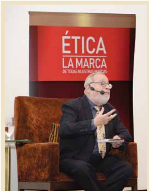
Para Fernando Savater, escritor y filósofo español, la confianza es el tejido que cobija nuestra relación con nosotros mismos y con los demás.

El evento, denominado "La confianza, pilar fundamental de la ética", tuvo como objetivo analizar el papel que desempeña la confianza en la construcción de relaciones íntegras y transparentes.