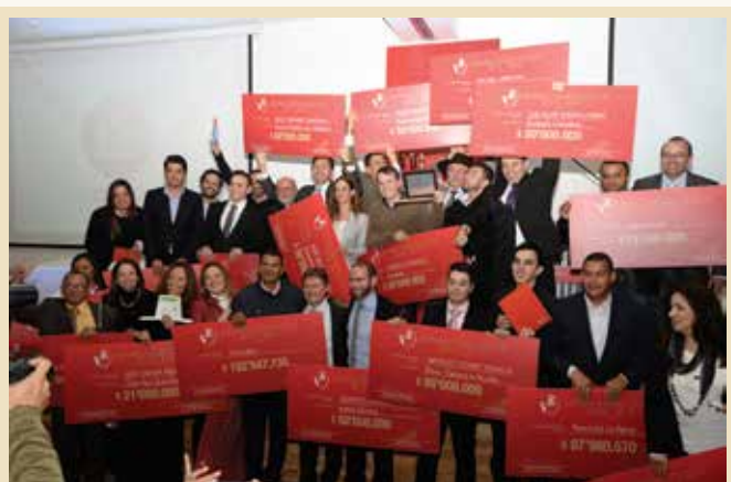
Ganadores del Ciclo 8° de Destapa Futuro en ceremonia de premiación.

Los ganadores, clasificados en las categorías Bronce, Silver, Dream Team y Social y Ambiental, recibieron 700 millones de pesos en capital semilla. De igual forma, cuatro emprendedores viajarán en el 2015 a Washington DC, con el fin de atender reuniones comerciales con empresarios que les permitirán realizar nuevos negocios y fortalecer su red de relacionamiento.