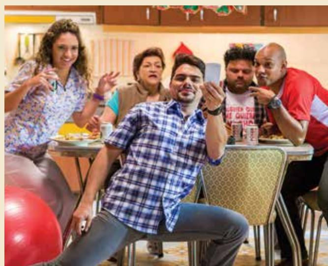
En línea con el concepto de comunicación de Póker, “Entre Panas” narra entretenidas historias de un grupo diverso de amigos que se reúne a pasar buenos momentos.

La serie, que ha registrado récords de visualizaciones –alcanzando hasta diciembre del 2014 cerca de 10 millones de reproducciones-, fue la apuesta creativa más importante de la marca durante el segundo semestre del 2014 para captar las audiencias que están migrando de los medios tradicionales a los digitales, buscando contenidos afines y divertidos a los que puedan acceder en cualquier momento y lugar.